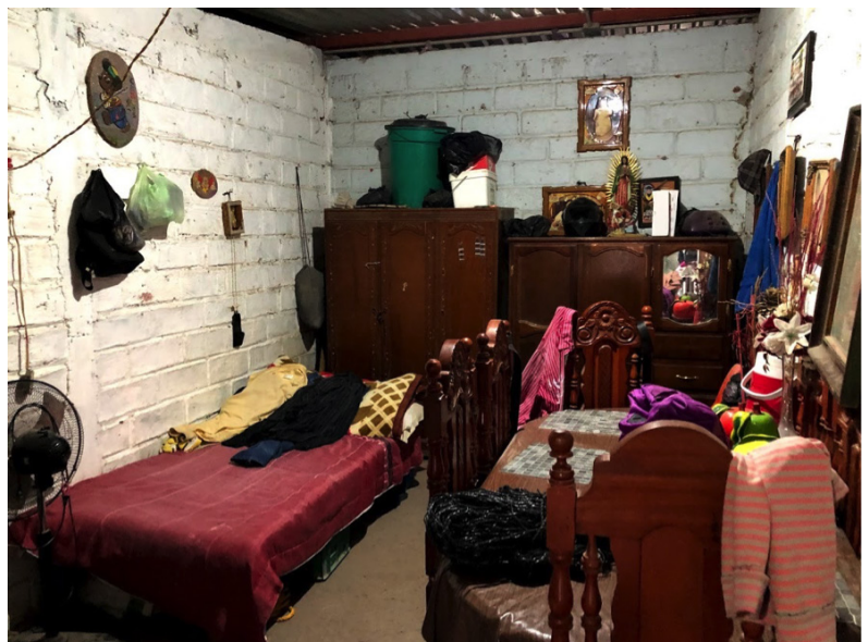
Vivienda de jornaleros agrícolas en Sinaloa Autor: Agustín Escobar Latapí