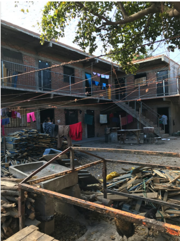
Cuartería en la Sindicatura de Villa Benito Juárez en el municipio de Navolato Autora: Elisa Martínez Rubio.